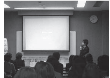
ならコープ主催 COP15報告会 （於：奈良県中小企業会館）

奈良県生協連も加入する「温暖化防止 COP15 ネットワーク関西」では、COP15 で先送りされた課題を COP16(メキシコで 11～12月開催)で国際社会が合意し、日本国内での実効的な取り組みをすすめるように、今後も市民の立場で見守っていきます。