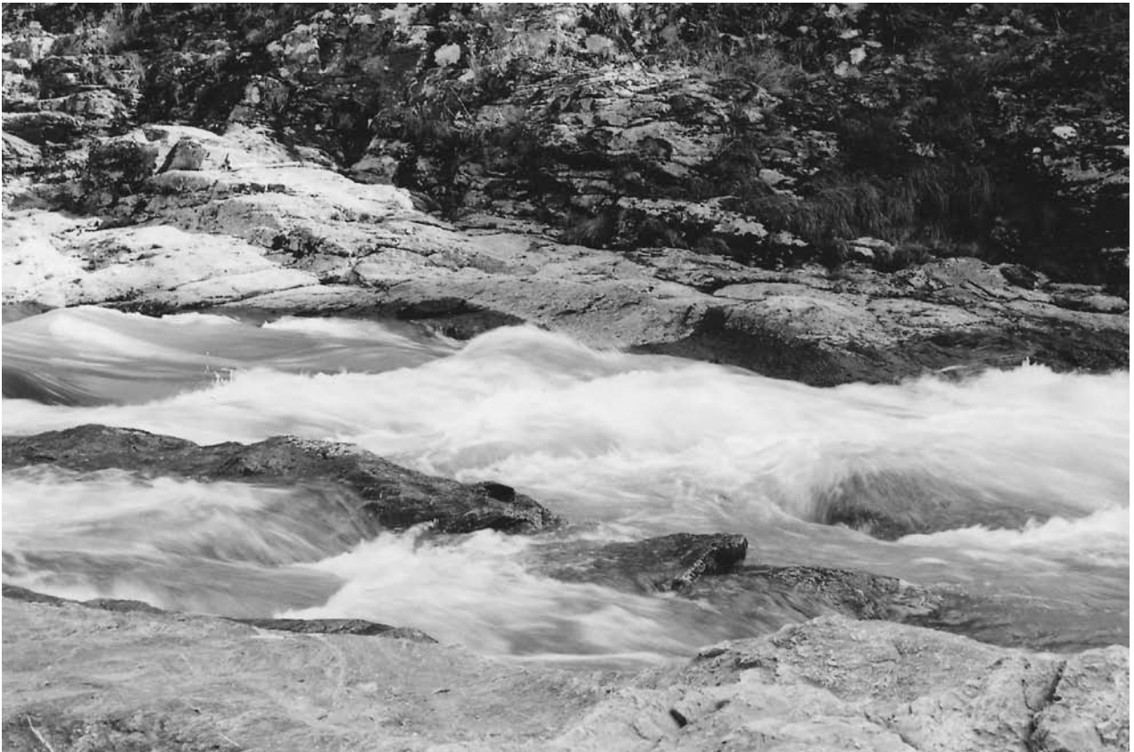
滝の河内 宮滝の激流

山高み しらゆふばな 白木綿花に 落ちたぎつ たぎ かふち 滝の河内は 見れど飽かぬかも かさの 笠 かな 金 むら 村