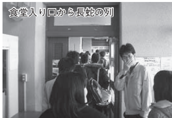
食堂入り口から長蛇の列