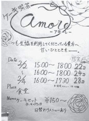
入り口の看板に案内が

2月2日、生協学生同好会（大学生協の学生委員会にあたります）のみなさんの「ケーキ喫茶」がオープン。そこで取材に行ってきました。