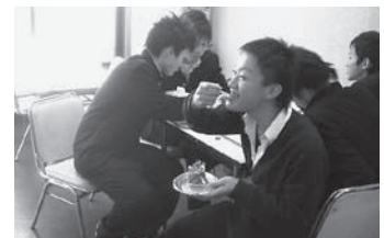
生協食堂大ファンの2年生。「ケーキ、うめ〜！」とほおぼってくれました。