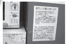
電子レンジ導入は組合員の声から